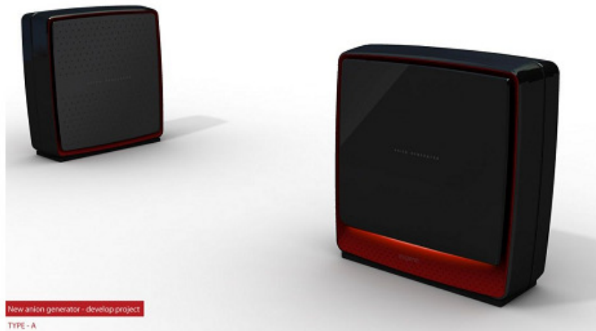
New anion generator - develop project